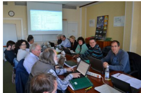
Réunion d'équipe PLUME à Toulouse, novembre 2011.

La plate-forme PLUME (Promouvoir les Logiciels Utiles, Maîtrisés et Economiques dans l'ESR) a annoncé le 18 novembre sa 1000e fiche descriptive de logiciels et de ressources validés par la communauté de l'Enseignement Supérieur et de la Recherche (ESR). Depuis quatre ans, PLUME offre aux chercheurs, enseignants, ingénieurs et techniciens des universités et des laboratoires de recherche, une plateforme accessible par le web, qui leur permet de trouver la description de logiciels pour la plupart « libres », évalués, validés et commentés par des utilisateurs experts. Initié au sein du CNRS et ouvert à l'ensemble des acteurs de la recherche et de l'enseignement supérieur, le projet PLUME a profité dès le début de contributions et d'un soutien important de la part de l'IN2P3, notamment grâce au centre de calcul à Lyon qui héberge les serveurs.