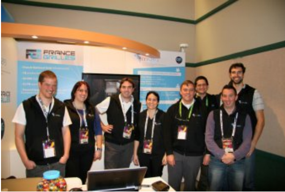
L'équipe du CC-IN2P3 présente à SuperComputing.

Du 12 au 18 novembre dernier a eu lieu la conférence SuperComputing au Washington State Convention Center de Seattle. Cette manifestation réunit l'ensemble des acteurs industriels et académiques présents dans le domaine du calcul haute performance pendant une semaine de conférences, de workshops et de présentations. Durant cette manifestation, les participants rivalisent d'imagination pour attirer les nombreux visiteurs (près de 10 000 personnes) sur des stands souvent impressionnants.